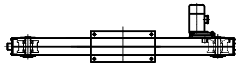
Балка концевая опорная г.п. 5 т